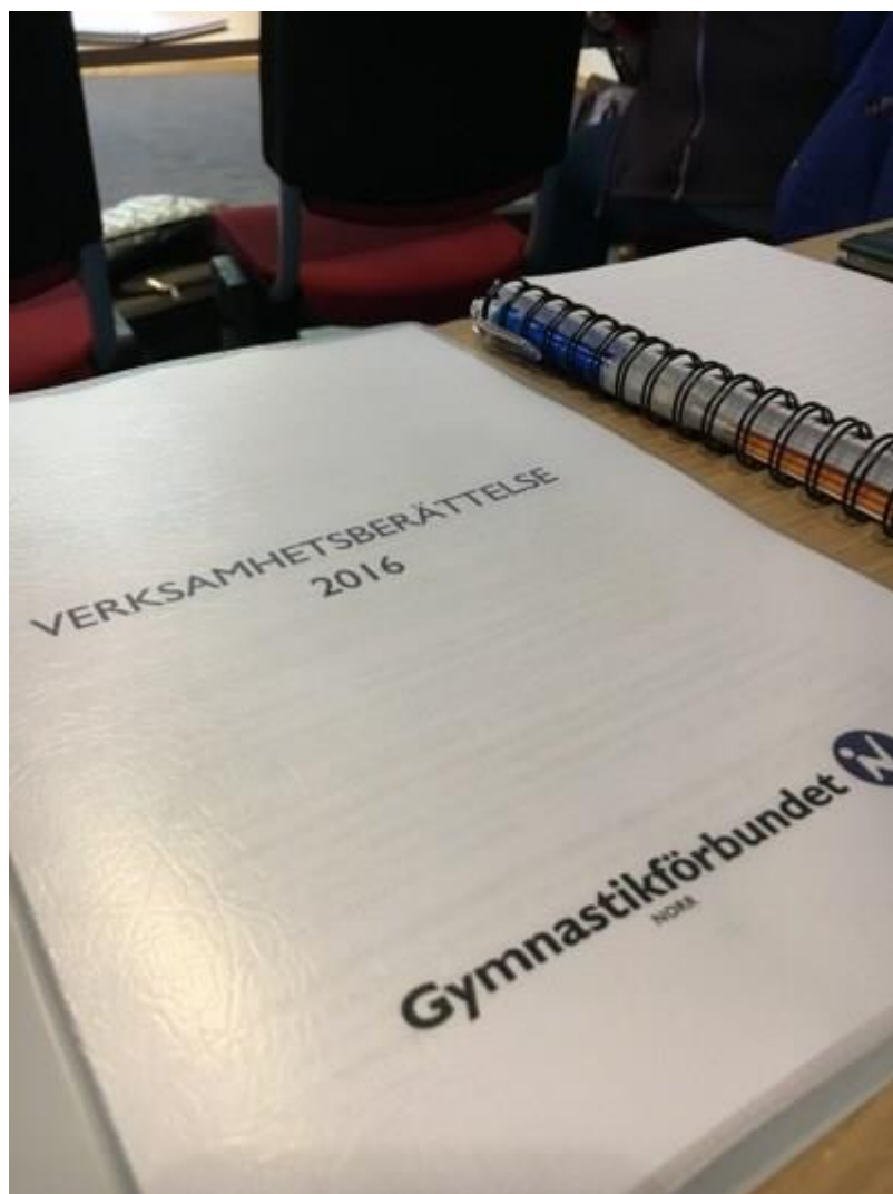
2016 års verksamhetsberättelse.